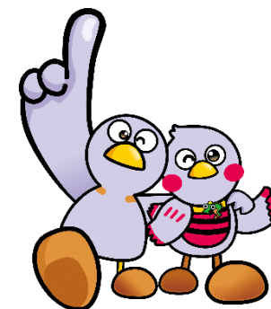
埼玉県マスコット コバトン&さいたまっちゃん

令和7年度入試までの 部活動に関する記入箇所 （「3 特別活動等の記録」 の欄のその他）を 令和8年度入試は、 「5 その他」 の欄へ変更します。