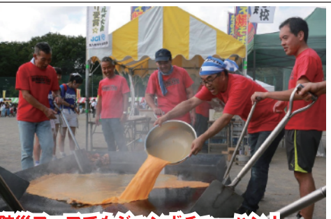
防災フェアでもジャンボチャーハン！

上野台小学校に通う子どもたちのために、おやじの「愛」と「パワー」と「光る汗」を見せたい！そんなおやじを募集しています。 ※無理せず参加できる行事だけお越しいただければ結構です。無理は禁物。仕事第一です！※入会金や会費はございません（Tシャツ代、酒席代等は実費です）。 ※入会をご希望の方は、上野台小学校ホームページの「おやじの会」のページより申込書をダウンロードし、必要事項をご記入の上、学校の先生にご提出下さい。 上野台小学校のホームページURLはこちら！ http://www.fujimino.ed.jp/ue/