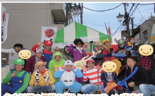
おやじ達の仮装も楽しいハロウィン楽市！