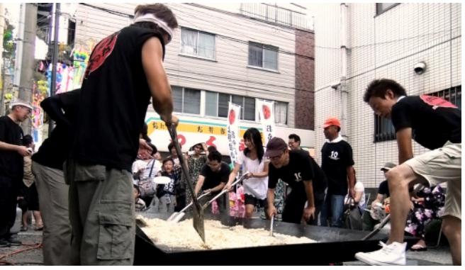
上野台小学校の先生方もたくさん応援に駆けつけてくださいました！ありがとうございました！