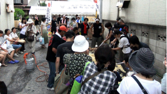
巨大鉄板の周りはギャラリーでいっぱい！！ みなさん、近寄りすぎると熱いですよ～～(笑)！！

「おあがんなんしょ」でお餅つき 東日本大震災＝被災された方々との交流会＝ 5月8日(日)社協および市民活動支援センター主催の「おあがんなんしょ」で、南相馬市からふじみ野市へ避難してこられた方々と「餅つき」を通して交流をもちました。 当初は、みなさんを励まそう！元気づけよう！と思っていましたが、子ども達や家族の笑顔を見ていて、いつしか私達も心の奥底に忘れかけていた“きずな”“家族”の大切さを改めて思い出し、逆におやじの会のおやじたちが元気をもらい、あたたかな気持ちで癒されていました。 でも少しは故郷の味で楽しんでもらえたのかな？(寺本)