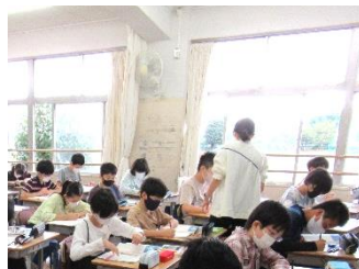
みんなそろって学習