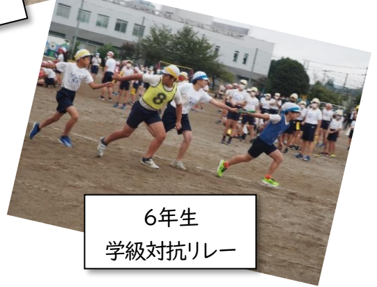
6年生 学級対抗リレー