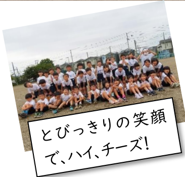
とびっきりの笑顔 で、ハイ、チーズ!