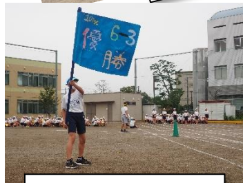
全力で仲間を応援!