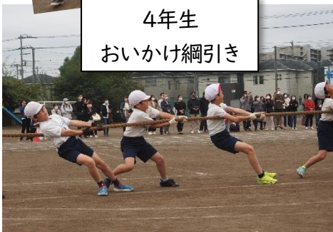
4年生 おいかけ綱引き