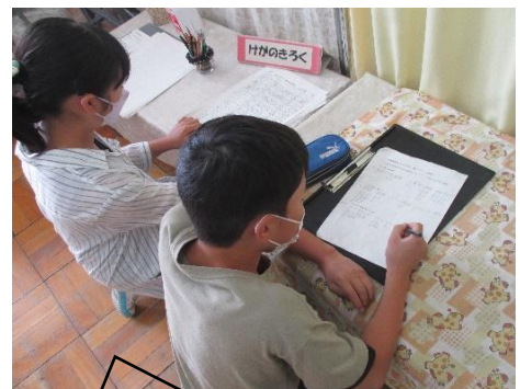
保健室でけがの数を調べました。