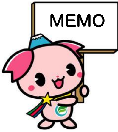
ふじみ野市 PR 大使『ふじみん』