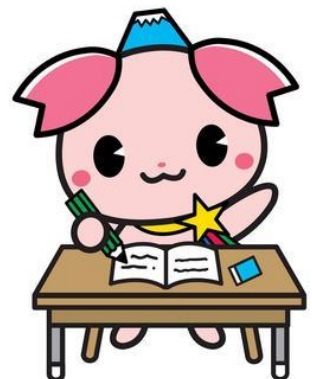
ふじみ野市 PR 大使『ふじみん』