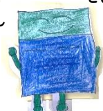
よろこんでいる 本君