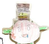
教科書と 読書くん