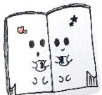
兄妹のほぼちゃ んとほぼくん