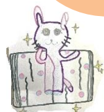
本の羽をひろ げてとぼう!

4年生が2学期の図工の授業で、学校図書館のキャラクターを作ってくれました! 館内のどこかに隠れているので、みんなで見つけてみてね。キャラクターの特性にも 注目です!