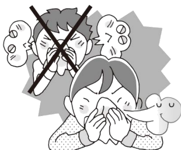
はなをかむときは片方ずつ