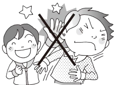
みみちかたをたたかない