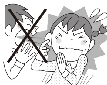
みみもとのおおごえだを出さない