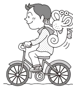
じてんしゃに乗る