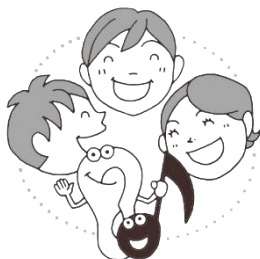
ともだちと会話する