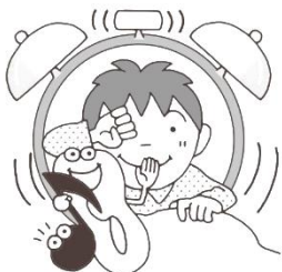
めざまし時計のおとをきく