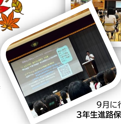
9月に行われた 3年生進路保護者会の様子