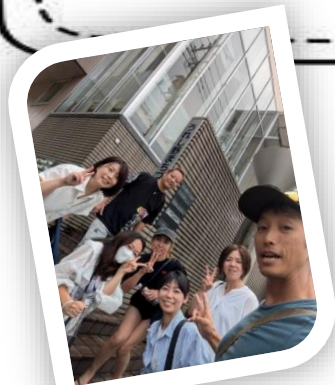
9月 うれし野まちづくり会館にて本部会