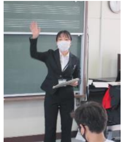
令和3年度後期教育実習生 F・E