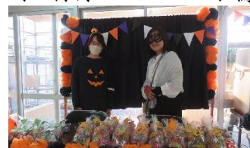
【受付：お菓子ブース】

地域の〇〇さん、〇〇さん、〇〇さんは、子供たちが安全に来られるよう誘導をしてくださいました。180名を超える児童の参加です。4時半から続々と子供たちが来校しました。仮装している子供たちがたくさんいます。コースの説明と絶対に走らないこと等の約束をして、ドキドキワクワクしながら、校舎内のお化け屋敷へ。悲鳴が校舎外にも聞こえます。低学年の中には泣いてしまう子もいましたが、「楽しかったぁ!」と満面の笑みの子もいました。高学年の子供たちも「すごかった!」「もう一回行きたいです!」と切望していました。職員も参加させていただきました。その時は特別バージョンで、驚かせ方もハイレベルでした。「1回目でこんなにすばらしい内容だなんて、もう10回ぐらいやっているかのようですね」と、参加された保護者の方のお話に大きくなすきました。子供たちのひとみ かがやく笑顔がたくさん見ることができ、安全に開催できましたのも、この企画、準備、運営をしてくださいました学校運営協議会、PTAの皆様のおかげです。心より感謝申し上げます。ありがとうございました。