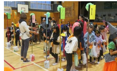
【出発に並ぶ子供たち】