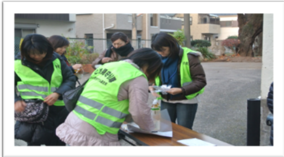
校外委員会 パトロール