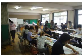
PTA ベルマーク回収作業