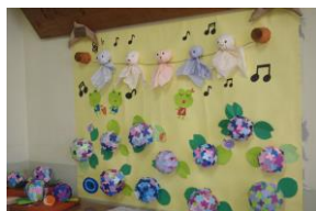
学校応援団の掲示物