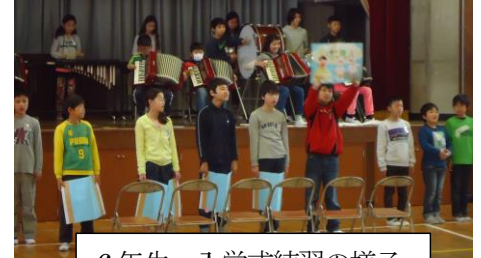
6年生 入学式練習の様子

6年生は、学校の要です。リーダーがしっかりしていれば、全校にやる気の息づかいが流れ始めます。6年生が中心になれるように、担任だけでなく、全教職員で成長を見守っていきます。