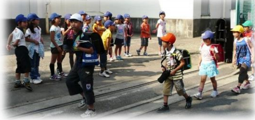
○あいさついっぱい