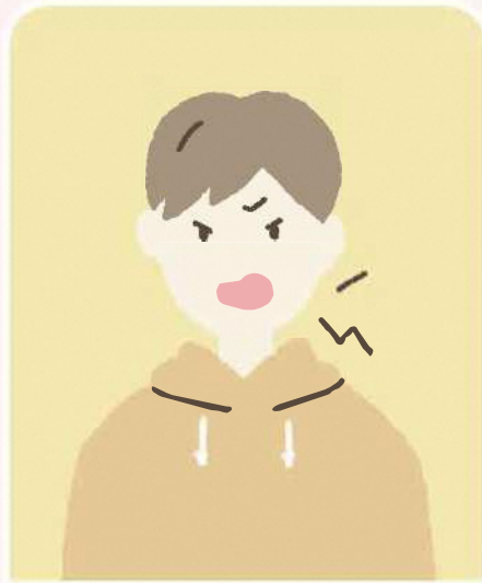
怒りやすくなった