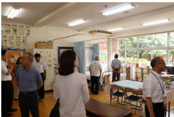
委員の皆様とともに、実際に校内をまわりました。

合わせて、いくつかの学級で5時間目の授業を見学しました。委員の方々からは、子どもたちの学習の様子についてお褒めの言葉をいただきました。