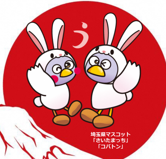
埼玉県マスコット 「さいたまっち」 「コバトン」